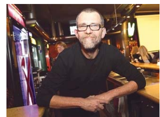
Disco Getaway verliert an sozialer Bedeutung