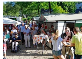
Nümmener feiern ihr Heimatfest