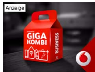
Vodafone GigaKombi Business