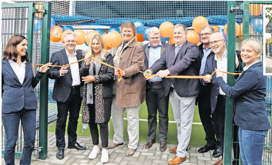
Das Band ist feierlich durchgeschnitten und die neue Freiluftsporthalle eröffnet.

Die neue Halle kann das ganze Jahr über auch bei Regen und Schnee genutzt werden und ist ab sofort bequem online buchbar. Sie eignet sich für Vereine und Sportkurse, aber auch für Freizeitsportler, Schulen, Kitas, Betriebe und Familien, die die neue Freiluftsporthalle beispielsweise für Kindergeburtstage, Betriebsfeiern und Sportveranstaltungen mieten können. Neben Fußball sind dort Netzsportarten wie Volleyball oder Badminton sowie gymnastische Sportarten möglich. Hinter