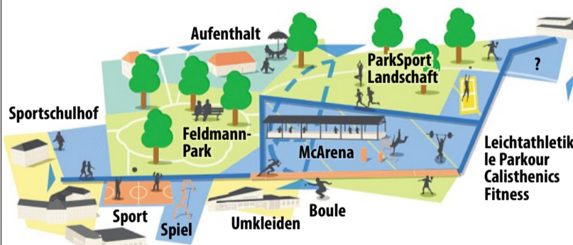
Skizze vom geplanten Sportpark in Styrum.

Bereits vor zwei Jahren hatten die Sportverwaltung und Planer gemeinsam mit den Bürger und Vereinen in einem Ideenwettbewerb damit begonnen, erste Entwürfe für einen Sportpark aufzustellen. Zahlreiche Vorschläge kamen dazu aus der Bürgerschaft. Das größte Fragezeichen stand damals noch hinter der Finanzierung.