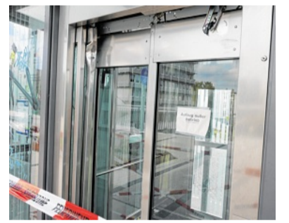
Die Schäden an der Fahrstuhltür sind deutlich erkennbar.

Nach Auskunft von Stadtsprecher Volker Wiebels handelt es sich jetzt um Vandalismus, „man könnte auch fast von Sabotage sprechen.“ An der Tür sei offenkundig manipuliert worden, Spuren von Gewaltwirkungen durch ein Werkzeug oder einen Gegenstand sind deutlich erkennbar. Die äußere Fahrstuhltür an der Hochpromenade steht offen, die Metallteile sind deutlich deformiert. „Das ist eigentlich mehr als Vandalismus“, meint Wiebels. Nun müsse die Firma aus Ratingen prüfen, ob sich der Schaden noch reparieren lasse oder die Tür erneut ausgetauscht werden müsse. Da es sich um eine Sonderanfertigung handelt, dürfte das einige Zeit in Anspruch nehmen. Im Sommer hatte die Behebung des Schadens rund 80 Tage gedauert. Technische Probleme gibt es auch wieder mit der Zählanlage, die die Radler registriert.